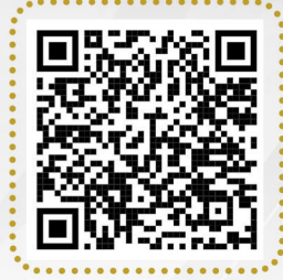
تقرير مشروع السلة الغذائية لأوقاف عبدالله بن تركي الضحيان