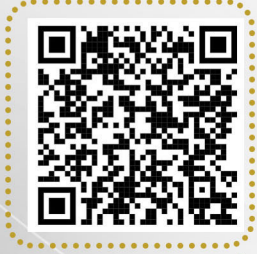
مشروع السلال الغذائية رمضان 1446 هـ