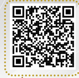
التقرير الختامي لمشروع التمكين التنموي ( منصة إحسان )