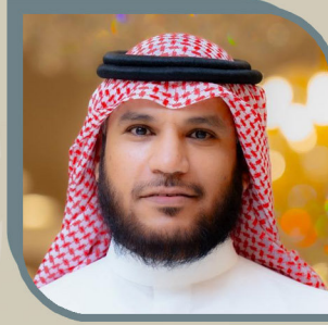
الأستاذ/ فهد بن محمد المجيد نائب الرئيس